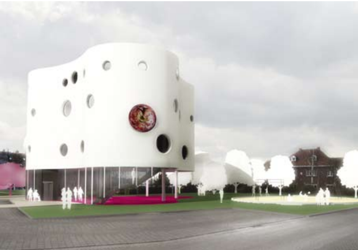
Maison de jeunes et salle polyvalente. Commune de Bocholt (B). Concours 2006